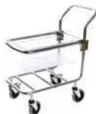
Гастрономическая тележка с поддоном